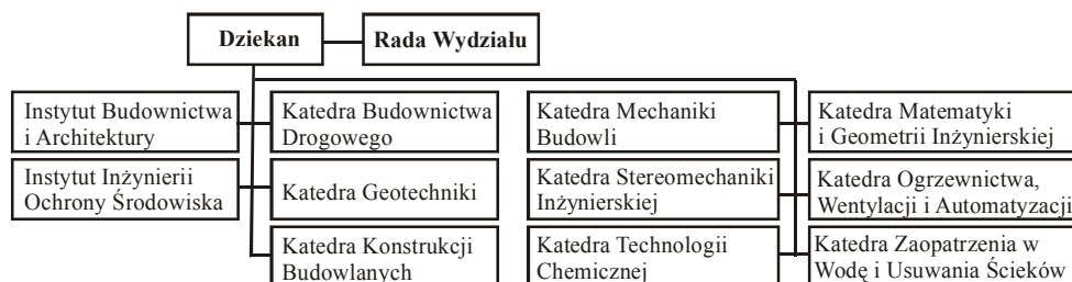
Rys. 3.1. Jednostki naukowo-dydaktyczne Wydziału Inżynierii Budowlanej i Sanitarnej

Na Wydziale Inżynierii Budowlanej i Sanitarnej badania naukowe i zajęcia dydaktyczne prowadzone są przez 9 katedr i 2 instytuty (rys.3.1.).